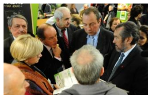
Serge Poignant, Député de Loire Atlantique