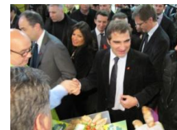
Christian Jacob, Président UMP à l'assemblée Nationale