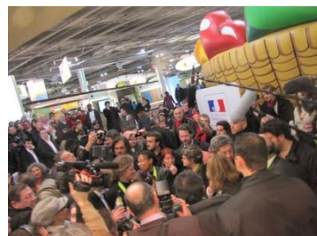
Des directs France 2 émission 13h15 Europe 1 Émission "La question environnement Radio Solidaire le 23 février TF1 JT de 13h du 24 février.....