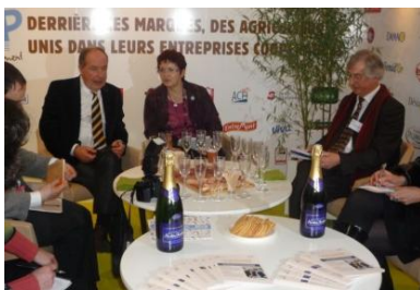
Conférence de Presse « Accord-cadre Coop de France/ VIVEA, un bilan positif un an après sa signature »