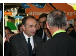
Jean François Copé, Secrétaire général UMP