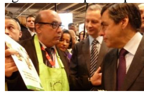
François Fillon, Premier Ministre Bruno Lemaire, Ministre de l'Agriculture et de la Pêche

Les politiques ont répondu présents à l'invitation lancée par la coopération agricole française. Certains ont découvert la démarche Agri Confiance, d'autres sont revenus pour encourager et soutenir l'avancée de la signature. Un petit reportage photo ( non exhaustif ) qui parle de lui-même.