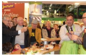
Jean Pierre Raffarin, Sénateur Vienne ancien Premier Ministre