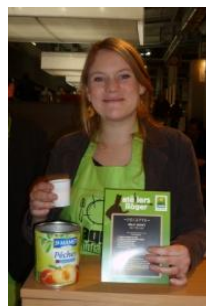
C. Liot-Conserves Gard