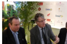
Jean Paul Delevoye, Médiateur de la République, Président du CESE