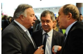
Gérard Larcher, Président du Sénat