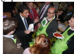
Pierre Lellouche, Secrétaire d'Etat chargé du commerce extérieur