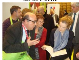
Nathalie Kosciusko Moriset, Ministre du MEDDTL