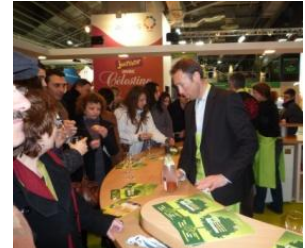
S. Vincent-Cave de Chautagne