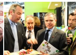
Bernard Accoyer, Président de l'Assemblée Nationale