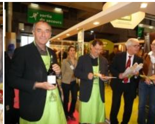
JL. Piton-Marrenon E. Mazeiraud- Aqualande G.Rivière-Copaline