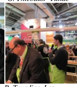
R. Tourdias, Les Vignerons Landais