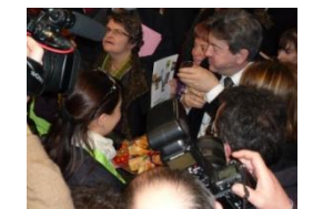
Jean Luc Mélenchon candidat Front de Gauche élection 2012