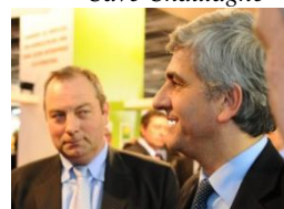
Hervé Morin, Maire d'Épaignes, députée de L'Eure, Président du nouveau Centre