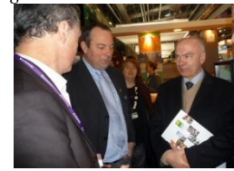
Marc Le Fur, Député des Côtes d'Armor