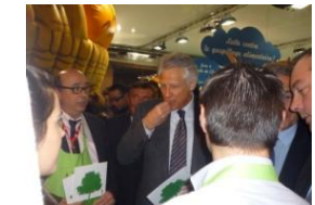
Dominique de Villepin, Ancien Premier Ministre