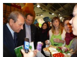
Bertrand Delanoë, Maire de Paris