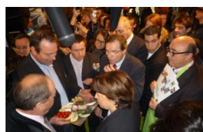
Martine Aubry, Première secrétaire du PS